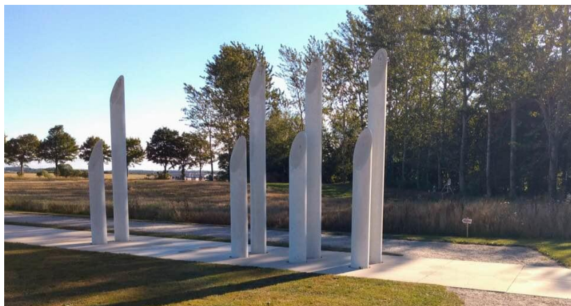
Udsnit af skibssætningen – med en Fodslaw pil i baggrunden

Vedr. vor næste DKT arrangement: Følg med på foreningens hjemmeside